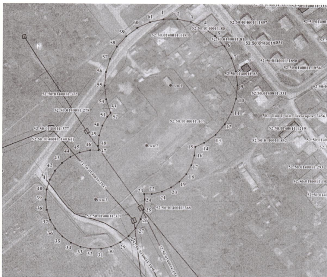
Координаты характерных точек границ второго пояса ЗСО скважин №№ 1-3 водозабора МУП «Лесогорск ЖКХ» в р.п. Лесогорск Шатковского района Нижегородской области